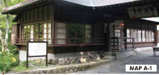
勝花亭 (しょうかてい) 松平定信は甲子の風光をたいそう愛し、しばしば是を遊覧し勝花亭はその折りの休所になったところです。