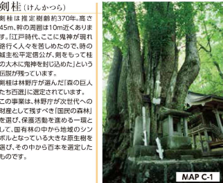
剣柱 (けんかづら) 剣柱は推定樹齢約3700年、高さ45m、幹の周囲は10m近くあります。江戸時代、ここに鬼神が現れ、路行く人々を苦しめたので、時の城主松平定信が、剣を刺さって柱の太木に鬼神を封じ込めたという伝説が残っています。剣柱は林野行が選んだ巨木の巨木たち百選に選定されています。この事業は、林野庁が次世代への財産として残すべく「国民の森」の理念を継ぎ、保護活動を進める一環として、国有林の中から地域のシンボルとなっている大きな原生樹を選び、その中から百本を選定したものです。