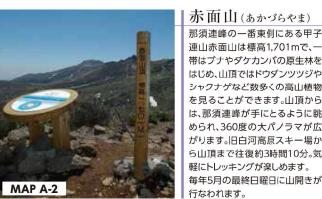
赤面山 (あかづらやま) 那須連峰の一峰剣柱にある甲子山赤面山は標高1701mで、一帯はブナやタカカンバの原生林をほじり、山頂ではドウダンツツジやシャブナギなど数多くの高山植物を見ることが出来ます。山頂からは、那須連峰が手ににぎるように眺められ、360度の大パノラマが広がります。白河高原スキー場から山頂まで往復約3時間10分。気軽にトレッキングが楽しめます。毎年5月の最終日曜日山開きが行われます。